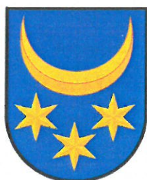
Město Velká Bystřice